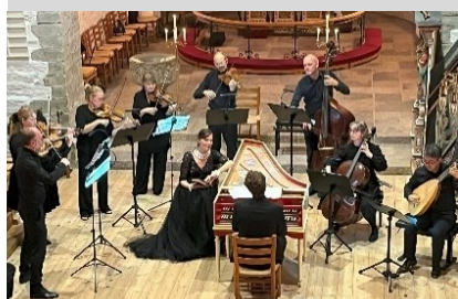
Camerata Øresund med Divaen som henført tilhører (10)

Efter sidste koncert blev to bornholmskbyggede cembali overdraget til Bornholms Musikfestival og Bornholms Musikforening.