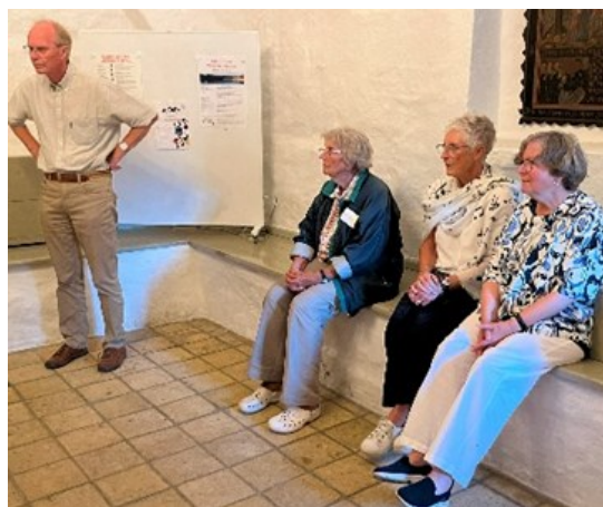
Medlemmer af Vennernes bestyrelse venter på, at P2s lydprøver er færdige, så publikum kan lukkes ind (8)

*) Formændene i de to bestyrelser er fødte medlemmer af den anden bestyrelse.