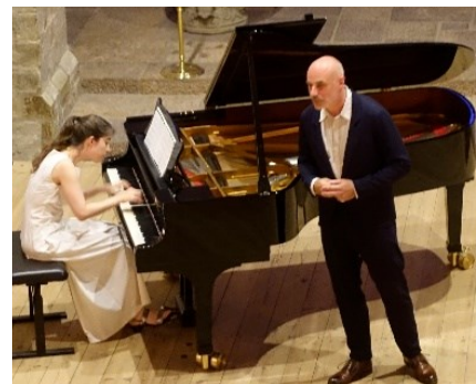
En intens Winterreise (9)

Begge bestyrelsers arbejde er uhonoreret og uegennyttigt, når man ser bort fra oplevelserne ved koncerterne, hvor bestyrelsens medlemmer har gratis adgang.