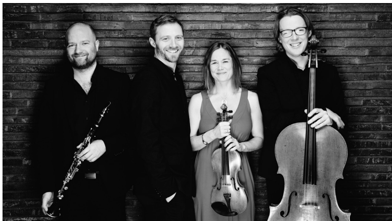
Messiaen Quartet Copenhagen