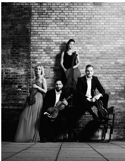
Nordic String Quartet