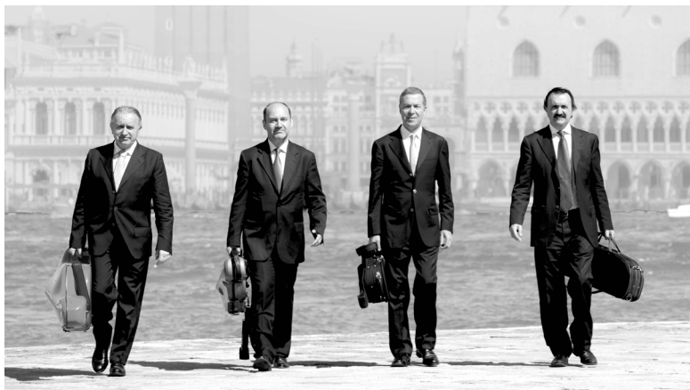
Quartetto di Venezia