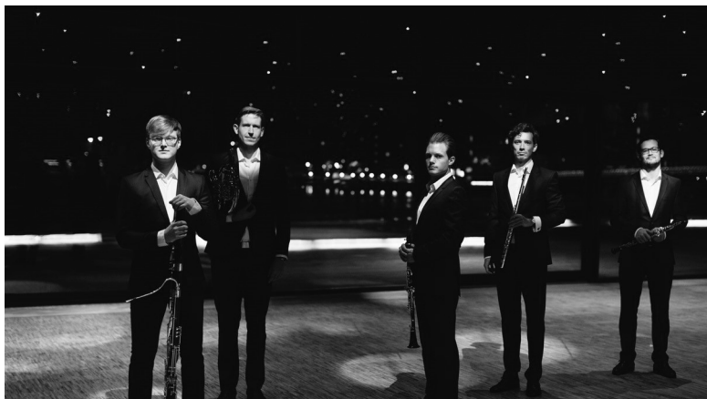
Carl Nielsen Kvintetten